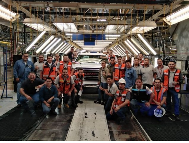
2020 மாலுக்கு முன், கடைசியாக ஜி.எம்.சி சியரா 2019 சிலோவில் தயாரிக்கப்பட்டது, ஆகஸ்ட் 9, 2019

வலியுறுத்தினோம். சோசலிச சர்வதேசியவாதத்தின் முக்கியத்துவத்தையும் தவிர்க்கவியலாத அவசியத்தையும் இது ஒரு புதிய மட்டத்திற்கு உயர்த்தியிருந்தது.