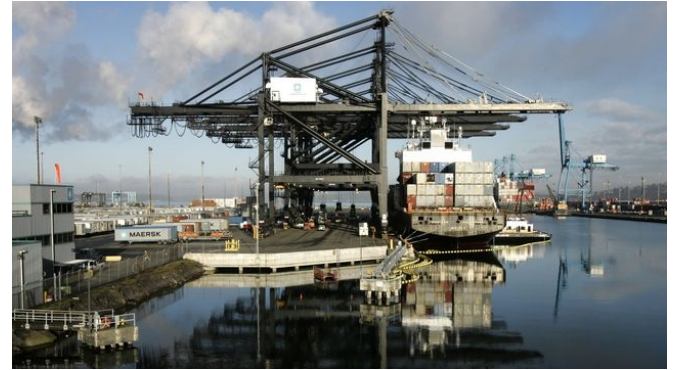
ஹொரைசன் லைன்ஸ் இன்க் நிறுவனத்திலிருந்து ஒரு கொள்கலன் கப்பல் பிப்ரவரி 13, 2008 புதன்கிழமை, டகோமா, வாஷில் உள்ள டகோமா துறைமுகத்தில் பொருட்களை இறக்குகிறது.

1988 முன்னோக்குகள் ஆவணம் வெளியிடப்பட்டு முப்பது ஆண்டுகளுக்குப் பின்னர், பொருளாதார அறிஞரான பிராங்கோ மிலனோவிக் வெளியிட்ட உலகளவிலான சமத்துவமின்மை (Global Inequality) என்ற தலைப்பிலான புத்தகம், உலகெங்கிலும் தொழிலாளர்களின் சமூக நிலைமை ஒன்றாக ஆவதைக் குறிப்பிட்டது, உலகம், “வர்க்கமே” “இருக்கும் இடத்தைக் காட்டிலும் மேலாதிக்கம் செலுத்துகின்ற பிளவாக” இருக்கின்ற ஒன்றாக ஆகிக் கொண்டிருந்ததான உண்மையை சுட்டிக்காட்டியது. இந்தப் பகுப்பாய்வானது, அனைத்துலகக் குழு கூறிய விடயங்களில், பொதுவாக முதலாளித்துவ பொருளாதார அறிஞர்களின் பிரகடனங்களைப் போலவே, தாமதமானது மற்றும் மதிப்பில் குறைந்ததே, என்றபோதும் 1988 தீர்மானத்தில் அடையாளம் கூறப்பட்ட நிகழ்ச்சிப்போக்குகள் அதிகரித்தளவில் மறுக்கவியலாத எதார்த்தமாயிருப்பதை அது பிரதிபலித்தது.