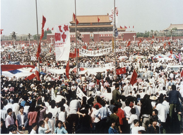
மே 1989 ல் தியனென்மென் சதுக்கத்தில் வெகுஜன ஆர்ப்பாட்டம்