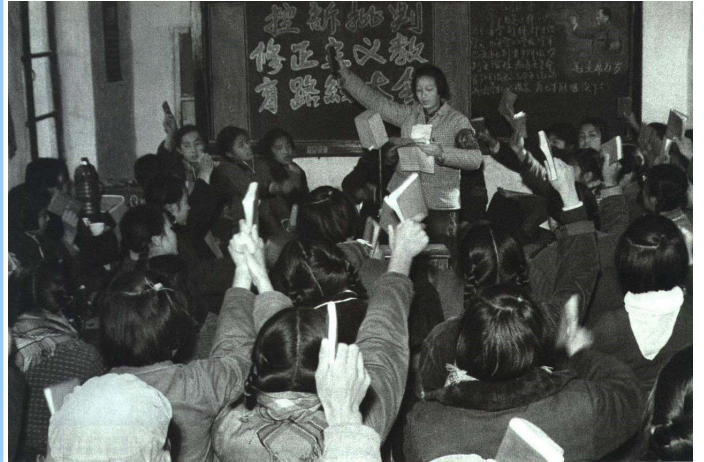
கலாச்சாரப் புரட்சியின் போது மாணவர்கள்

மாவோவும் அவரது கன்னையும் “முதலாளித்துவ பாதையமைப்பாளர்கள்” ஐ கண்டனம் செய்து, சோசலிசத்திற்கான தமது இணக்கத்தை பிரகடனம் செய்த அதேநேரத்தில், அவர்கள் வேறு மாற்று எதனையும் வழங்க முடியவில்லை. தன்னிறைவு பெற்ற சீனா குறித்த மாவோவின் கற்பனைக்கனா ஒரு பெருநாசமாக நிரூபணமானது. நாட்டை உலுக்கிக் கொண்டிருந்த தீவிரமான பொருளாதார மற்றும் சமூகப் பிரச்சினைகளை தீர்ப்பதற்கு திறனற்ற நிலையிலும், சோவியத் ஒன்றியத்துடன் ஒரு இராணுவ மோதலுக்கு முகம்கொடுத்த நிலையிலும், CCP அதிகாரத்துவமானது அமெரிக்க ஏகாதிபத்தியத்துடன் ஒரு சோவியத்-விரோத கூட்டணியை ஏற்படுத்தியது, இதுவே உலக முதலாளித்துவத்திற்குள் சீனா ஒருங்கிணைவதற்கான அடிப்படையை உருவாக்கியது. டெங் ஷியாவோப்பிங் தான் சந்தை சீர்திருத்தங்களுக்கு தொடக்கமளித்தவராக குறிப்பிடப்படுகின்ற போதிலும், 1972 இல் அமெரிக்க ஜனாதிபதி ரிச்சார்ட் நிக்சனுடன் மாவோ ஏற்படுத்திக் கொண்ட நல்லிணக்கம் தான் அந்நிய முதலீட்டுக்கான அத்தியாவசிய அரசியல் மற்றும் இராஜதந்திரரீதியான முன்-நிபந்தனையாக இருந்தது, மேற்குடனான வர்த்தகத்தை அதிகரித்தது.