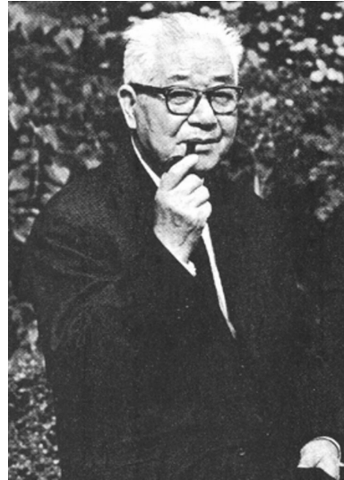
சீன ட்ரொட்ஸ்கிஸ்டான பெங் சூஷி

கொரியப் போரினால் உருவாக்கப்பட்ட பொருளாதார நெருக்கடி மற்றும், அமெரிக்க ஏகாதிபத்தியத்தால் "விடுதலை" செய்யப்படும் வாய்ப்பைக் கண்ட முதலாளித்துவ அடுக்குகளால் மேற்கொள்ளப்பட்ட உள்முக சதி ஆகியவற்றின் பின்னர் தான் மாவோயிச ஆட்சியானது, சோவியத் ஒன்றியத்தின் அதிகாரத்துவ பாணியில் தனியார் சொத்துக்களை பரந்த அளவில் பறிமுதல் செய்வதை நோக்கியும் மையப்பட்ட திட்டமிடலை நோக்கியும் திரும்பியது. கொரியப் போருக்கும் தொழிலாள வர்க்கத்தில் அமைதியின்மை பெருகி வந்ததற்கு மத்தியில் தான் CCP 1952 டிசம்பரில் சீன ட்ரொட்ஸ்கிஸ்டுகள் மற்றும் அவர்தம் குடும்பத்தார் அத்தனை பேரையும் சுற்றிவளைத்து சிறையிலடைத்தது.