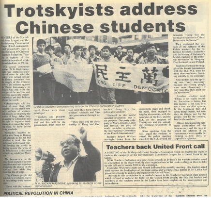
வேர்க்கர்ஸ் நியூஸ் மே 26 1989

சீன மாணவர்கள், தொழிலாளர்கள் மற்றும் புத்திஜீவிகளுக்கு தெளிவுபடுத்துவதில் மையமாக இருப்பது வரலாற்றுக் கேள்விகள்—சீனாவிலான புரட்சிகளை ஒரு இன்றியமையாத மூலபாகமாகக் கொண்ட சர்வதேசத் தொழிலாள வர்க்கத்தின் முக்கியமான மூலோபாய அனுபவங்கள்— ஆகும். ஆஸ்திரேலியாவில் பயிலும் சீன மாணவர்களுடன் நாம் நடத்திய கலந்துரையாடல்களில் இருந்து, லியோன் ட்ரொட்ஸ்கி குறித்தும் 1925-27 சீனப் புரட்சி மீதான ஸ்ராலினின் காட்டிக்கொடுப்பு குறித்தும் மிகக் குறைவாகவே தெரிந்திருக்கிறது அல்லது எதுவும் தெரியாதிருக்கிறது என்பதாய் தென்படுகிறது. 1949 புரட்சி மற்றும் கலாச்சாரப் புரட்சி போன்ற, அதனையடுத்த அபிவிருத்திகள் குறித்த எந்தவொரு அறிவும், ஸ்ராலினிச