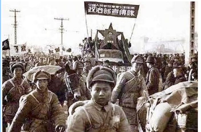
1949 சீனப் புரட்சியின் போது பெய்ஜிங்கிற்குள் நுழையும் மக்கள் விடுதலை இராணுவம்

1949 சீனப் புரட்சியானது முன்னேறிய முதலாளித்துவ நாடுகளிலும், அத்துடன் சீனா போன்ற தாமதமாக முதலாளித்துவ அபிவிருத்தி அடைந்த நாடுகளிலும் இரண்டாம் உலகப் போரைத் தொடர்ந்து எழுந்த புரட்சிகரப் போராட்ட அலையின் பகுதியாக இருந்தது. பிற்போக்கான மற்றும் நெருக்கடி-நிறைந்திருந்த கோமின்டோங் ஆட்சி தூக்கிவிசப்பட்டமையானது, நாட்டை பிளவுபடுத்தி அதனை அழுக்கடைந்த மற்றும் பிற்போக்கான நிலையில் அமிழ்த்தி வைத்திருந்த ஏகாதிபத்தியத்திற்கு எதிரான ஒரு பிரம்மாண்டமான அடியாக இருந்தது. அரசியல் எழுச்சி மற்றும் போரின் பல தசாப்தங்களுக்குப் பின்னர் பொருளாதார பாதுகாப்பிற்கும், அடிப்படை ஜனநாயக மற்றும் சமூக உரிமைகளுக்கும், மற்றும் ஒரு கண்ணியமான வாழ்க்கைத் தரத்திற்கும் மிகப்பெருவாரியான மக்கள் கொண்டிருந்த அபிலாசைகளை அது வெளிப்படுத்தியது.