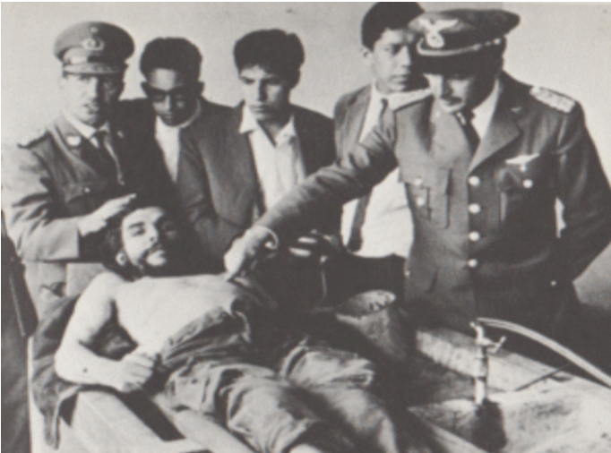
சி.ஐ.ஏ மற்றும் பொலிவிய இராணுவத்தின் கைகளில் படுகொலை செய்யப்பட்ட பின்னர் சே குவேரா

பொலிவியாவில் 1967 அக்டோபரில் அவரைக் கைப்பற்றி கொலை செய்ய வழிவகுத்த கொடிய சாகசத்தை மேற்கொண்ட சே குவேராவின் தலைவிதி, காஸ்ட்ரோயிசம் மற்றும் பப்லோவாத திருத்தல்வாதத்தின் பேரழிவுகரமான விளைவுகளின் துன்பகரமான எதிர்பார்ப்பாக இருந்தது.