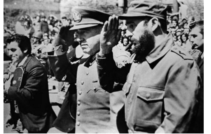
1971 இல் காஸ்ட்ரோ மற்றும் சிலியின் சர்வாதிகாரியான ஜெனரல் அகுஸ்டோ பினோசே

அமெரிக்காவில் உள்ள முதலாளித்துவ அரசாங்கங்களுடன் அவர் நடைமுறையில் உறவுகளை ஏற்படுத்தினார். சிலியில், காஸ்ட்ரோ “சோசலிசத்திற்கான பாராளுமன்ற பாதையை” புகழ்ந்தார், இராணுவம் ஒரு ஆட்சிக் கவிழ்ப்பு சதிக்கு தயாரிப்பு செய்து கொண்டிருந்த வேளையிலும், அலண்டே அரசாங்கத்திற்கு கீழ்ப்படியுமாறு தொழிலாளர்களிடம் கூறினார். அவர் ஈக்குவடோர் மற்றும் பெருவிலுள்ள இராணுவ ஆட்சிகளை அவதானித்தார் மற்றும் 1968 இல் மெக்சிக்கோவில் மாணவ எதிர்ப்பாளர்களை படுகொலை செய்ததை தொடர்ந்து, உடனடியாக மெக்சிக்கன் ஆளும் கட்சியான PRI இன் ஊழல் எந்திரத்துடன் நெருக்கமான உறவுகளை ஏற்படுத்திக் கொண்டார்.