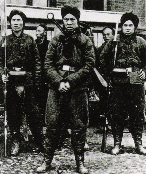
1900 இல் பாக்ஸர் போராளிகள்

1895 இல் ஜப்பானிய ஏகாதிபத்தியத்தின் கரங்களில் சீனா தோல்வி கண்டது ஒரு அதிர்ச்சியாக வந்தடைந்தது. வெளிநாட்டுத் துண்டாடல்களையும் நாட்டின் அடிமைப்படலையும் எவ்வாறு எதிர்ப்பது என்பது குறித்த விவாதத்தை அது தீவிரப்படுத்தியது. ஆயினும் இற்றுப்போயிருந்த மஞ்சு வம்சத்தை சீர்திருத்துவதற்கும் வழக்கொழிந்த அரசாங்க எந்திரமுறையை உருமாற்றுவதற்குமான முயற்சிகள் பலனளிக்கவில்லை. 1898 இல், இளம் சக்கரவர்த்தியான குவாங்குவின் கீழ் கொண்டுவரப்பட்ட “நூறு நாட்கள்” என்று அழைக்கப்பட்ட சீர்திருத்தம், டோவாகர் பேரரசி சிக்ஸியால் திடீரென முடிவுக்குக் கொண்டுவரப்பட்டது. அவர் தனது மருமகன் குவாங்குவை சிறைப்பிடித்ததோடு அவரது சீர்திருத்த ஆலோசகர்களை தூக்கிவிட்டார் அல்லது சிறையிலடைத்தார்.