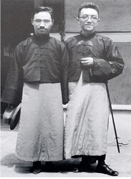
சென் துவியோ (இடது)

1915 இல், நிலவிய அரசியல் குழப்பத்திற்கு மத்தியில், 1911 புரட்சியிலும் 1913 இல் யுவான் ஆட்சிக்கு எதிரான ஒரு கலகத்திலும் செயலாக்கத்துடன் இயங்கிய சென் துவியோ ஜப்பானில் நாடு கடந்து வாழ்ந்த நிலையில் இருந்து ஷங்காய் திரும்பினார். புதிய இளைஞர் (New Youth) என்னும் இதழை அவர் ஸ்தாபித்தார், இது மாணவர்களின் புதிய தலைமுறையை ஈர்க்கும் ஒரு சக்திவாய்ந்த காந்தமாக நிரூபணமாகியது. மக்கள் பெரும்பாலும் அணுகலின்றி இருந்த சீன மொழியின் அறிஞர் பெருமக்களது செவ்வியல் மொழிவடிவத்தைக் காட்டிலும் பெருவாரி மக்கள் பேச்சுவழக்கு மொழிவடிவத்தில் வெளிவந்த முன்னோடியான வெளியீடுகளில் ஒன்றாக அது இருந்தது.