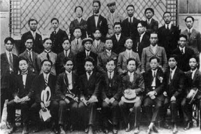
சீன கம்யூனிஸ்ட் இளைஞர் கழகத்தின் பிரதிநிதிகள் 1924 இல் பாரிஸில்

1919 மே-ஜூன் ஆர்ப்பாட்ட இயக்கத்தை தொடர்ந்து சோசலிச ஆய்வுக்கான சங்கங்கள் பல்கிப் பெருகின. ஆயினும், 1919 மார்ச்சில், லி டாசோவ் இடம் இருந்து ஆதர்சம் பெற்று, பீக்கிங் பல்கலைக்கழக மாணவர்கள் மார்க்சிச தத்துவ ஆய்வுக்கான ஒரு சங்கம் ஒன்றை ஸ்தாபித்தனர். சீனாவில் 1919 இல் நடந்த நிகழ்வுகளை உன்னிப்பாக கவனித்து வந்த மூன்றாம் அகிலம், 1920 ஆரம்பத்தில், தொடர்புகள் உருவாக்குவதற்காக தூர கிழக்கு செயலகத்தில் இருந்து கிரிகோரி வோய்டின்ஸ்கியை பெய்ஜிங்கிற்கு அனுப்பியது. வோய்டின்ஸ்கி லி ஜ சந்திக்க, லி ஷாங்காயில் இருந்த சென் துஷியோவை சந்திக்க அவரை அனுப்பினார்.