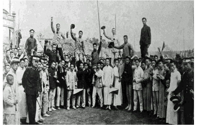
மே 4 ஆர்ப்பாட்டக்காரர்கள் சிறையில் இருந்து அவர்கள் விடுதலையான பின்னர்

ஜன் 10 அன்று, வேலைநிறுத்தங்களும் ஆர்ப்பாட்டங்களும் தொடர்ந்த நிலையில், ஜப்பானிய-ஆதரவு அமைச்சர்கள் மூவரின் இராஜினாமாவை அரசாங்கம் அறிவித்தது. ஆயினும் சீனா, வேர்சாய் உடன்படிக்கையில் கையெழுத்திடக்கூடாது என்ற முக்கியமான கோரிக்கை பூர்த்தியடையவில்லை. ஜன் 24 அன்று, பெரும் சக்திகளிடமான அதன் ஆட்சேபம் தோல்வியடைந்தபோதும், ஆவணத்தில் கையெழுத்திடுவதற்கு சீனப் பிரதிநிதிக்குழுவிடம் அரசாங்கம் உத்தரவிட்டது. கோபமான போராட்டம் பிரவாகம் எடுத்ததற்கு முகம்கொடுத்த நிலையில், ஜனாதிபதி அடுத்த நாளே தனது முடிவை மாற்றிக் கொள்ள நிர்ப்பந்தம் பெற்றார். ஜன் 28 அன்று, ஜேர்மனியுடன் அமைதி உடன்படிக்கையில் கையெழுத்திடுவதில் முக்கிய சக்திகளுடன் இணைந்து கொள்ள சீனாவின் பிரதிநிதிகள் மறுத்துவிட்டனர்.