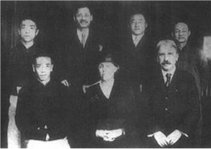
ஷங்காயில் ஜோன் டூவி (முன் வலது), 1919

1919 மே 4 அன்று தொடங்கிய போராட்டங்களும் வேலைநிறுத்தங்களும் முன்னோக்கிய பாதை குறித்த ஒரு அனல்பறக்கும் புத்திஜீவித மற்றும் அரசியல் விவாதமும் இணைந்து வந்தது. தாராளவாதிகள் மற்றும் அரசாங்கவாதிகள், ஜனநாயகவாதிகள், தொழிற்சங்கவாதிகள் மற்றும் பல்வேறு வகையான சோசலிஸ்டுகள் என பல போட்டித் தரப்புகளும் இதில் இருந்தன. மே 4 ஆர்ப்பாட்டத்தை ஒட்டி சீனாவுக்கு வந்த அமெரிக்க மெய்யியலாளரான ஜோன் டூவி, அடுத்த இரண்டு ஆண்டுகளில், தனது உரைகள் மற்றும் கட்டுரைகள் மூலமாக ஒரு ஆதரவாளர் கூட்டத்தை கொண்டிருந்தார். பிரிட்டிஷ் மெய்யியலாளரான பேர்ட்ரான்ட் ரஸ்ஸலும் சீனாவில் உரையாற்ற அழைக்கப்பட்ட பின்னர் ஆதரவாளர்களை வென்றெடுத்திருந்தார், 1920 அக்டோபர் முதலாக கிட்டத்தட்ட ஒரு ஆண்டு அவர் அங்கேயே இருந்தார்.