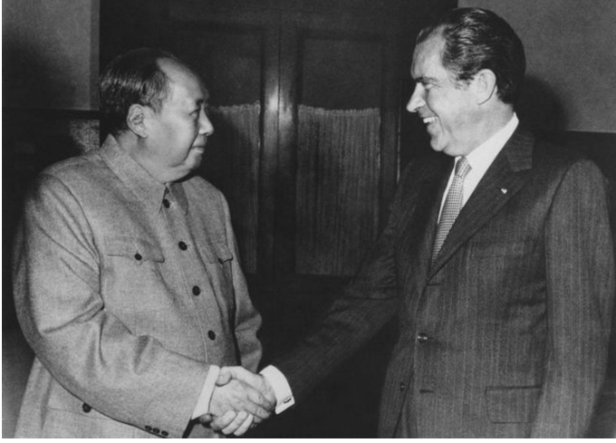
1972 இல் மா சேதுங்கும் ரிச்சார்ட் நிக்சனும்

உண்மையில், மாவோதான் முதலாளித்துவ பாதையில் பயணித்தவர்களில் தலைமையானவராய் நிரூபணமானார். தனது கன்னை எதிரிகளுக்கு எதிராக செங்காவலர் படையை அவர் ஏவி முடிக்கும் முன்பே, தொழிலாள வர்க்கம், 1967 இல் ஷங்காய் மக்கள் கம்ப்யூன் ஸ்தாபகத்துடன் முன்னணிக்கு வந்தது. சூழ்நிலையை கட்டுக்குள் கொண்டுவர இராணுவத்தை அழைத்ததுதான் மாவோவின் பதிலிறுப்பாக இருந்தது. 1969 க்குள்ளாக, செங்காவலர் படையில் இருந்த நோக்குநிலை பிறழ்ந்த இளைஞர்கள் வெறுமனே பெய்ஜிங்கின் கன்னைப் போராட்டங்களில் பகடைக்காய்களாக ஆக்கப்பட்டிருந்தனர்.