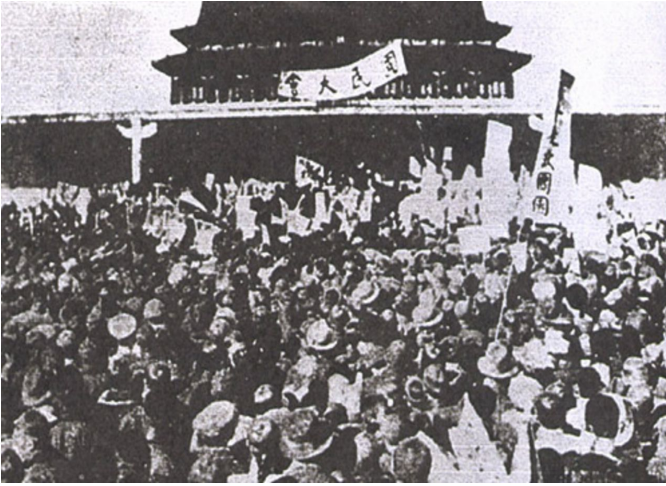
மே 4 அன்று ஆர்ப்பாட்டக்காரர்கள்

துண்டறிக்கைகளை விநியோகம் செய்தும், ஜப்பானியப் பொருட்களுக்கு பதிலாக சீனப் பொருட்களை வாங்கும்படி மக்களை வலியுறுத்தியபடியும் வீதிகளில் பிரச்சாரம் செய்து கொண்டிருந்த மாணவர் குழுக்களின் மீது ஜன் ஆரம்பத்தில் அரசாங்கம் ஒரு பாரிய ஒடுக்குமுறையைத் தொடுத்தது. ஜன் 2 அன்றான முதல் கைதுகளுக்குப் பின்னர், அடுத்தடுத்த நாட்களில் ஆயிரக்கணக்கான மாணவர்கள் வீதிகளில் இறங்கினர், இவர்களில் சிலர் சிறைவாசத்திற்குத் தாங்கள் தயார் என்பதை உணர்த்தும் விதமாக முதுகில் படுக்கைகளை சுமந்தபடி வந்தனர். ஜன் 4 முடிவதற்கு முன்பாக, ஆயிரத்துக்கும் மேற்பட்ட மாணவர்கள் துருப்புகளால் சூழப்பட்ட நிலையில் இருந்த பீக்கிங் பல்கலைக்கழகத்தின் கட்டிடங்களது தற்காலிக சிறைகளில் தடுத்து வைக்கப்பட்டிருந்தனர்.