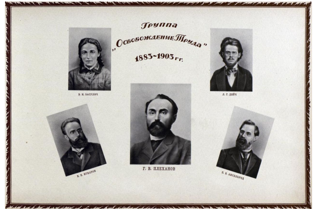
பிளெக்ஹானோவினால் (நடு) ஸ்தாபிக்கப்பட்ட தொழிலாளர் விடுதலைக் குழு

அம்பலப்படுத்தியமையானது, ஜேர்மன் சமூக ஜனநாயகக் கட்சியை அதன் தலைமைக்குள் திருத்தல்வாதத்தின் வளர்ச்சியை எதிர்த்து நிற்க நிர்ப்பந்தம் செய்தது. பேர்ன்ஸ்டைன் குறித்த அவரின் விமர்சனங்கள் —“பேர்ன்ஸ்டைனும் சடவாதமும், நாம் அவருக்கு எதற்காக நன்றி சொல்ல வேண்டும்?”, “கான்ட்டுக்கு எதிராக முடியாதா அல்லது திரு.பேர்ன்ஸ்டைனின் உயிலும் இறுதி விருப்பமுமா” (“Cant Against Kant or Herr Bernstein’s Will and Testament”), மற்றும் “சடவாதம் அல்லது கான்ட்டியவாதம்” போன்ற அவரது எழுத்துக்களில் வெளிப்படுத்தப்படுகின்றன— கவனமாகப் படிப்பதற்குக் கோருகின்ற மார்க்சிச தர்க்கவிவாதவியலின் செதுக்கியபடைப்புகள் ஆகும்.