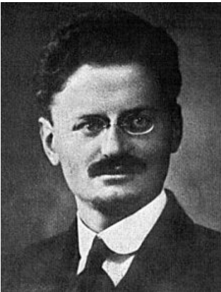
1971 இல் ட்ரொட்ஸ்கி

தலைவர்கள் எதற்கு? கட்சிகள் எதற்கு? திட்டங்கள் எதற்கு? தத்துவார்த்தப் போராட்டங்கள் எதற்கு? ஆகிய ட்ரொட்ஸ்கியின் கேள்விகள், ஏப்பிரல் ஆய்வுகளின் மிகவும் தீர்க்கமானதாய் கூறத்தக்க விளைபயன் மூலமாக அடிக்கோடிடப்படுகின்றன. 14 ஆண்டுகால அரசியல் வேறுபாடுகளுக்குப் பின்னர், விளாடிமிர் லெனினையும் லியோன் ட்ரொட்ஸ்கியையும் ஒன்றாகக் கொண்டு வந்த ஆவணமாக இது அமைந்திருந்தது.