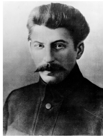
1917 இல் ஸ்ராலின்

முதலாளித்துவ அரசாங்கத்திற்கு எந்தவித ஆதரவும் கிடையாது, போருக்கு எதிரான கட்சியின் எதிர்ப்பில் எந்த மாற்றமும் கிடையாது, சோவியத்துக்களும் தொழிலாள வர்க்கமும் ஆட்சி அதிகாரத்தை கைப்பற்றுவதற்குப் போராட வேண்டும் என்பதிலும் எந்த மாற்றமும் கிடையாது, என, லெனின் அவரது தொலைவில் இருந்து எழுதிய கடிதத்தில் வகுத்திருந்த அரசியல் பாதை, போல்ஷிவிக் தலைமையால் அலட்சியம் செய்யப்பட்டது. அவரது நான்கு கடிதங்களில் ஒன்று மட்டுமே பிராவ்தாவில் பிரசுரமேனும் செய்யப்பட்டிருந்தது, அதுவும் கூட, இடைக்கால அரசாங்கத்திற்கு ஆதரவளிக்கும் எவரும் "தொழிலாளர்களுக்கு துரோகியாவார், உழைப்பாளிகளின் நன்மைக்கும் சமாதானம் மற்றும் சுதந்திரத்திற்கான நன்மைக்கும் துரோகம் செய்பவராவார்." என லெனின் கண்டனம் செய்திருந்த பகுதியை அகற்றியமை உட்பட, அந்தக் கடிதம் கணிசமாக திருத்தப்பட்டிருந்தது."[10]