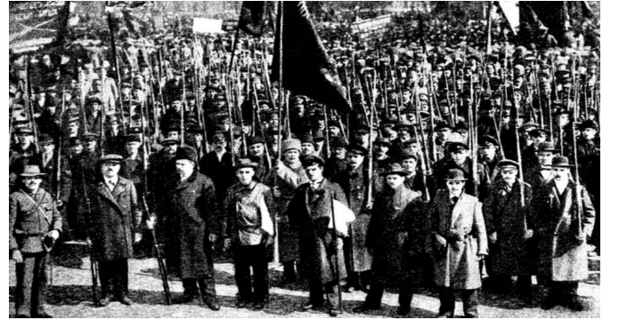
தொழிலாளர் போர்ப்படை, மே 1917

லெனினும் போல்ஷிவிக்குகளும் எதிர்பார்த்திருந்ததைப் போலவே, மற்றும் லியோன் ட்ரொட்ஸ்கியும் அவரது நிரந்தரப் புரட்சித் தத்துவத்தில் மிகவும் தெளிவாக எதிர்பார்த்திருந்ததைப் போலவே, புரட்சியில் தொழிலாள வர்க்கமே முன்னணிப் பாத்திரத்தை ஆற்றியது. தங்கள் வர்க்க பின்னணியில், ரஷ்யாவின் பரந்த விவசாயிகளின் கீழ்மட்ட ஏழ்மைத் தட்டினரைச் சேர்ந்தவர்களாக இருந்த இலட்சக்கணக்கான சிப்பாய்களும் தொழிலாளர்களுடன் இணைந்தனர்.