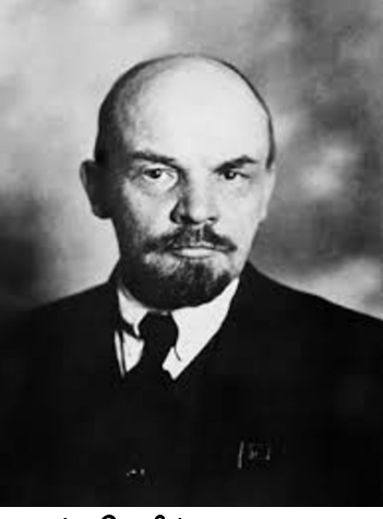
1917 ல், லெனின்

மார்ச் 1917 ல், லெனின் தனது 47 வது பிறந்த நாளை நெருங்கியிருந்தார். சுருக்கமாக கூறினால், அவர் வாழ்ந்த நிலைமைகள் வறியதாகும். அவர்கள் வாழ்ந்த அறை பற்றி குருபஸ்கயா நினைவுகூர்ந்தபோது எழுதியதாவது: "அது ஒரு பழைய இருண்ட அறை, அது பதினாறாம் நூற்றாண்டில் கட்டப்பட்டதாயிருக்கும் என நினைக்கிறேன், மற்றும் தூர்நாற்றம் வீசும் ஒரு முற்றம் இருந்தது." 1916 இன் பிற்பகுதியில் "எங்கள் வாழ்க்கைச் செலவுகளை மிகக்குறைந்தபட்ச அளவிற்கு நாங்கள் சுருக்கிக் கொள்ள நேர்ந்தது"[2] என அவர் சுட்டிக் காட்டியிருந்தார். நாடுகடந்து வாழ்ந்த போல்ஷிவிக்குகள் வளப் பற்றாக்குறையால் பாதிக்கப்பட்டிருந்தனர் - லெனினின் உடல்நலப் பிரச்சினைகளுக்கு இதுவும் ஒரு காரணமாக இருந்தது என்பதில் எந்த சந்தேகமுமில்லை.