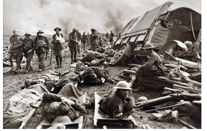
முதல் உலகப் போரின்போது Passchendaele போரில் காயமடைந்த படையினர்

அனைத்துக்கும் மேலாக, லெனின் பகுப்பாய்வு செய்ததைப் போல, அப்போரானது தற்செயலானதோ, இந்த அல்லது அந்த தேசிய அரசாங்கத்தின் பிழைகள் மற்றும் தவறான கணக்கீடுகளின் விளைவோ அல்ல. அப்போரானது, முதலாளித்துவ-ஏகாதிபத்திய உலக ஒழுங்கமைப்பின் பொருளாதார மற்றும் புவிசார் அரசியலில் அமைப்பு-தழுவிய பெரும் சிதைவு என்பதற்கு குறைவின்றி எதையும் பிரதிநிதித்துவம் செய்யவில்லை. முதலாம் உலகப் போர் வெடிப்பானது, மில்லியன் கணக்கான மக்களைப் பயங்கரம் மற்றும் முன்பில்லாத வன்முறை சுழலுக்குள் இழுத்து வந்து, அமைப்புமுறை-தழுவிய தோல்விக்கு, ஐரோப்பிய முதலாளித்துவ ஆளும் வர்க்கங்கள் காட்டிய விடையிறுப்பாக இருந்தது. அப்போரானது அடுத்து அமைக்கப்படவிருந்த ஒரு புதிய பொருளாதார மற்றும் அரசியல் சமநிலையின் மீது, காலனித்துவ உடைமைகளையும் செல்வாக்கு மண்டலங்களையும் புதிதாக பங்கிட்டுக் கொள்வதை அவசியப்படுத்தி, ஓர் "அமைப்பை மீளமைப்பு" (system reset) செய்வதற்கான அவர்களின் நடைமுறையாக இருந்தது.