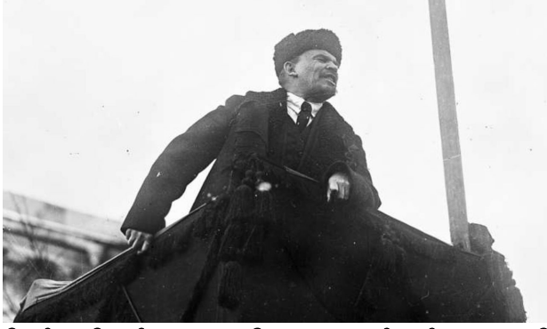
லெனின், வெற்றிகரமாக ஆட்சியை கைப்பற்றிய பின்னர் மாஸ்கோவில் பேசுகிறார்

தோல்வியானது, அந்நெருக்கடியை முதலாளித்துவ அடிப்படையிலோ, அல்லது ரஷ்ய தேசியவாத கட்டமைப்பிற்குள்ளேயோ தீர்க்க முடியாது என்ற உண்மையை உறுதிப்படுத்தியது.