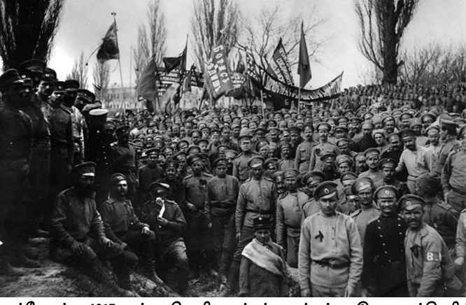
அக்டோபர் 1917 ல் தொழிலாளர்கள் மற்றும் இராணுவத்தினரின் ஆர்ப்பாட்டம்

இடைக்கால அரசாங்கத்தை ஆதரித்திருந்த அதே கட்சிகளுடன் சமரசம் செய்து கொண்டு கூட்டணி அமைப்பதென்பது அக்டோபர் புரட்சியைக் கைத்துறப்பதற்கு ஒப்பானதாக இருந்தது. மத்திய குழு அங்கத்தவர்கள் அனைவரிலும், ஒரேயொருவர் மட்டுமே கிளர்ச்சியை எதிர்த்தவர்களுடன் கூட்டணி வைக்க கூடாதென்ற லெனினின் மறுப்பைத் தங்குதடையின்றி, பலமாக பாதுகாத்தார்: “முக்கியமாக, நல்லிணக்கத்தைக் குறித்து நான் பேசக்கூட விரும்பவில்லை,” என்று அறிவித்த லெனின், “ஒற்றுமை சாத்தியமே இல்லை என்பதை நீண்டகாலத்திற்கு முன்னரே ட்ரொட்ஸ்கி தெரிவித்திருந்தார். ட்ரொட்ஸ்கிக்கு இது புரிந்திருந்தது, அப்போதிருந்து அவரை விட சிறந்த போல்ஷிவிக் யாரும் கிடையாது.” [7]